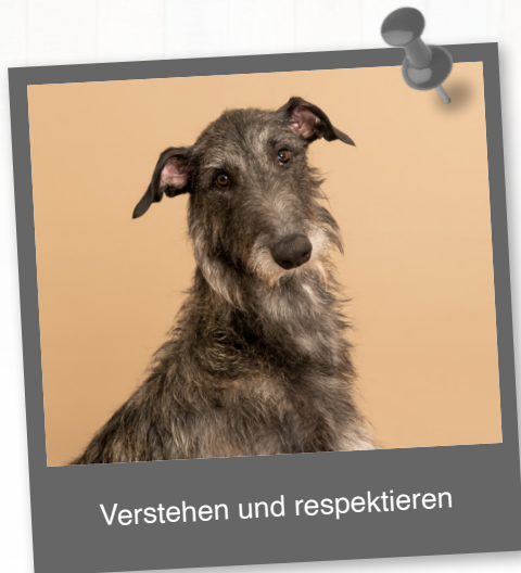
Verstehen und respektieren