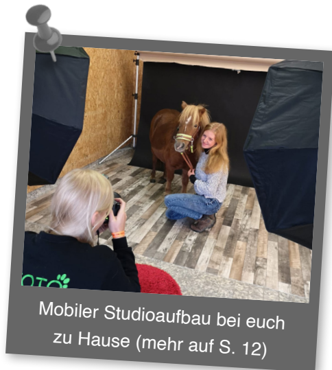
Mobiler Studioaufbau bei euch zu Hause (mehr auf S. 12)