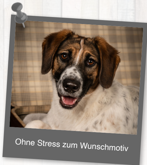
Ohne Stress zum Wunschmotiv