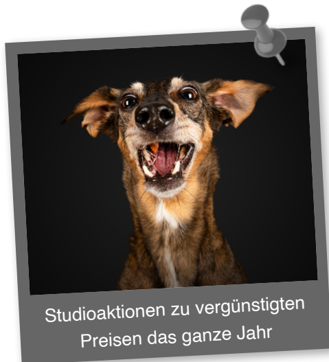
Studioaktionen zu vergünstigten Preisen das ganze Jahr