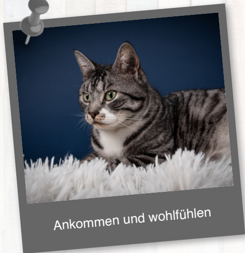
Ankommen und wohlfühlen