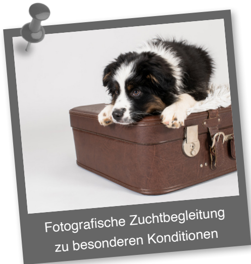
Fotografische Zuchtbegleitung zu besonderen Konditionen