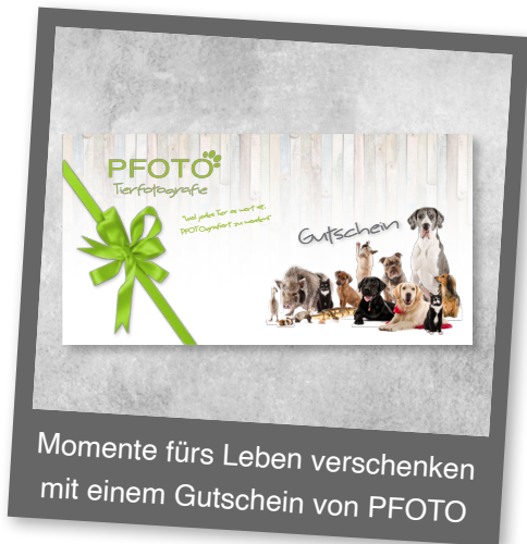
Momente fürs Leben verschenken mit einem Gutschein von PFOTO